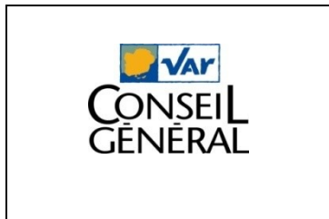
Conseil général du Var www.var.fr