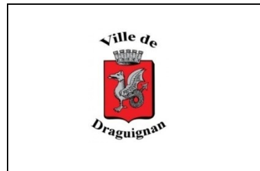
Ville de Draguignan www.ville-draguignan.fr