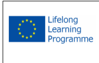
Lifelong Learning Programme www.europe-education-formation.fr