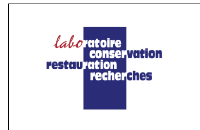
Laboratoire de Conservation, Restauration et Recherches www.art-conservation.fr