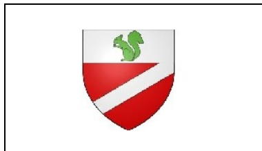
Ville de Figanières www.figanieres.com