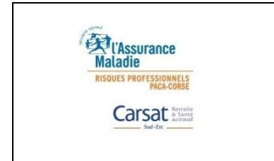
Caisse d'assurance maladie retraite et de la santé au travail Sud-Est www.carsat-sudest.fr